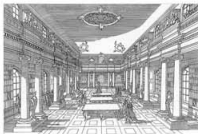
ライプツィヒ大学図書館（1773年築）

今年度は図書館に関して各種の工事が予定されている。来年、校舎「新棟建設のあとの地下食堂が書庫に転用」される予定となっているが、それに伴う工事があり2階閲覧室のカウンターの移設が本年8～9月に、地下食堂に集密書架の設置工事が12月に行われる。そのため図